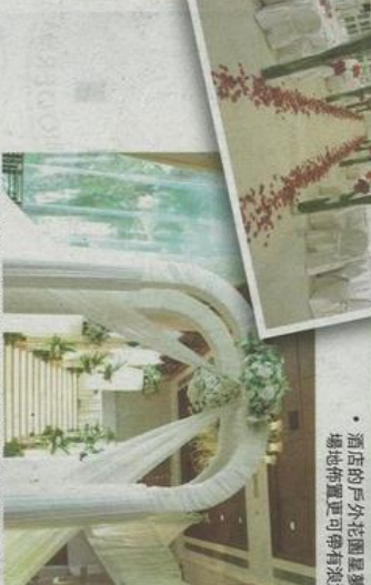
室內場地布置亦清新脫俗，貫徹希臘自然優美的感覺