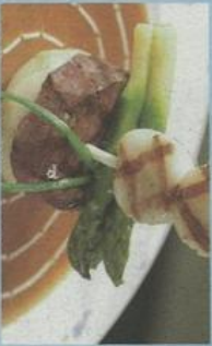
焗火烤五香牛柳配蠔油紅酒乾薑汁