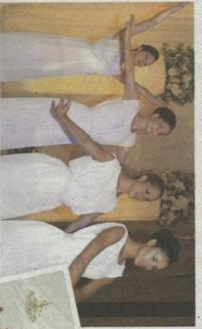
希臘式舞蹈表演及編排，為婚禮締造浪漫進場序幕

黃金海岸酒店將為各新人提供希臘式婚禮服務介紹，締造如置身希臘般的浪漫國度。當中包括：