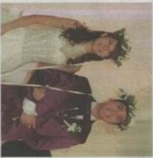
希臘式婚紗、禮服及希臘式頭冠，絲綢訂造及服務，盡顯婚禮別樹一格的一面