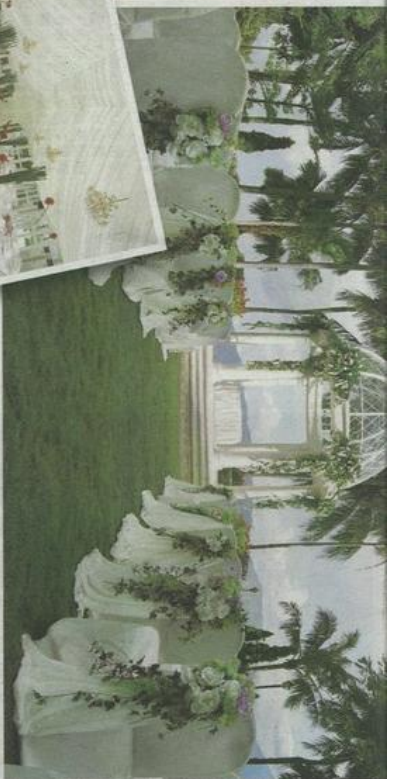
酒店的戶外花園是夢幻可供新人進行婚禮儀式，場地布置更可享有浪漫希臘海岸風情