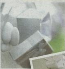
希臘各式婚堂禮品-「喜糖」讓到親友留下甜蜜永久回憶