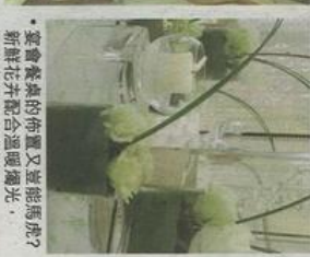
宴會廳的布置又豈能馬虎？新娘花衣配合溫暖燦光，為宴會添上高雅氣氛

一向積極發展創新婚慶服務的黄金海岸酒店，亦同時推出以下兩款新穎而具特色的婚慶菜單：